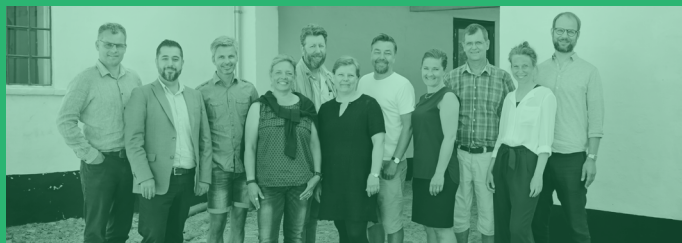
Styrelsen i FRISKOLERNE

FRISKOLERNES HUS Middelfartvej 77 5466 Asperup 62613013 kontakt@friskolerne.dk www.friskolerne.dk