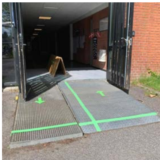
På denne skole har de brugt et stort stykke pap, som rumdeler i den travleste indgang. De grønne pile viser tydeligt, i hvilken side eleverne skal gå ind og ud.