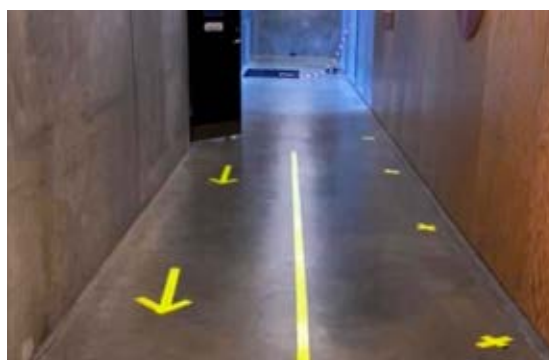
Her ses en åben toiletdør. Krydserne langs væggen viser tydeligt, hvor elever i kø til toilettet forventes at stå. Pilene hjælper til at holde gående elever og elever i kø adskilt.

TIP: Hvis I har mange vaske tæt på hinanden, så placér rød tape hen over de vaske, der ikke skal benyttes, og suppler med en grøn pil mod de vaske, som godt må bruges.