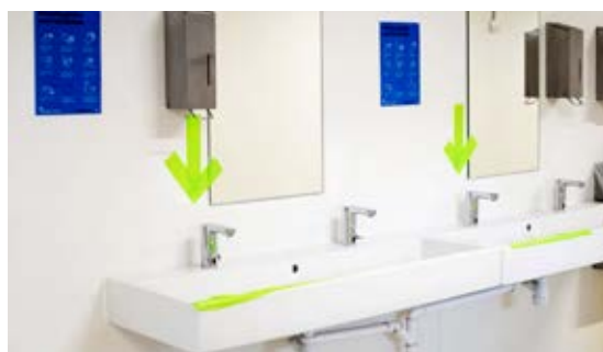
Denne skole har markeret tydeligt med pile, hvilke håndvaske børnene skal bruge. Hvis skolen ønsker, at håndvaskene uden grønne pile ikke anvendes, kunne et rødt kryds med fordel gøre opmærksom på det.