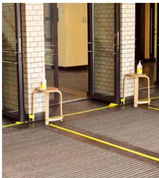
På skolen her har man gjort en stor indsats for at synliggøre håndspritten. Er formålet, at alle elever spritter hænder af, før de træder ind, kunne budskabet fremhæves ved at tilføje et skilt med teksten: 'Stop og sprit'.

OBS: Vær opmærksom på at håndsprit kan skade møblerne, så vælg gerne en gammel taburet eller lignende.