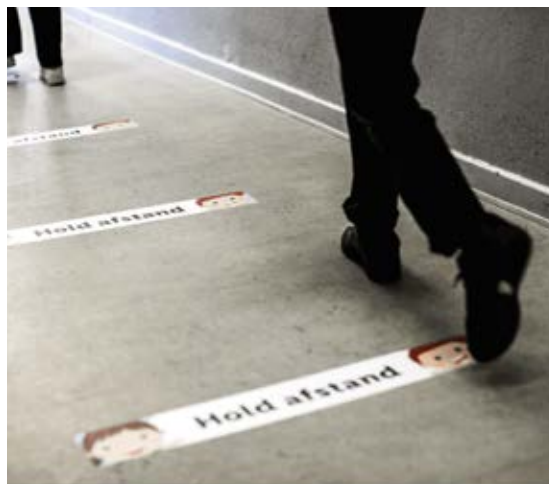
Denne skole markerer tydeligt, hvor eleverne skal stå i køen.

Placer stykker af tape med en meters afstand, der hvor eleverne normalt står i kø i kantinen.